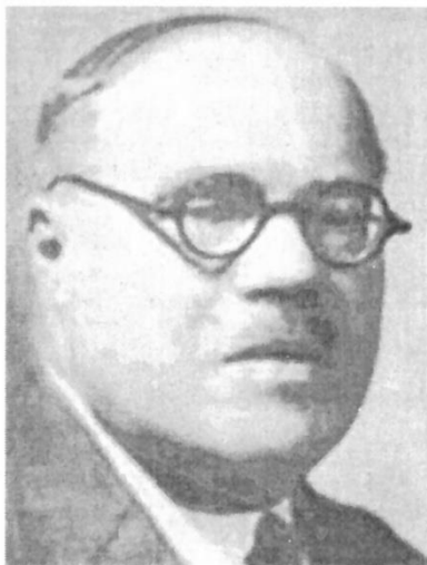
Francisco García Calderón

En El Perú Contemporáneo el lector puede percibir rápidamente el sentido integral que su autor quiere imprimir a sus páginas. De igual modo, dos décadas después, en 1928, Mariátegui, joven también, con 32 años de edad, publicaría la que sería la obra más importante de nuestro pensamiento social y político: los 7 ensayos. Mariátegui y García Calderón tienen algunos rasgos comunes que los aproximan. Uno, se trata de dos autores precoces; otra, es la admiración por la cultura francesa; otra más, la predilección del ensayo como vínculo de