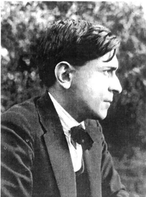
José Carlos Mariátegui

En diferentes oportunidades, Jorge Basadre fue enfático en señalar que 7 Ensayos de Interpretación de la Realidad Peruana de José Carlos Mariátegui tiene un antecedente directo en el libro que Francisco García Calderón escribió en francés y publicó en París, El Perú Contemporáneo . En 2007 se cumple un siglo de este libro, uno de los fundadores del pensamiento social peruano, y que se inscribe en el objetivo de renovación de los estudios peruanistas que había iniciado la generación del novecientos, luego de la derrota sufrida en la Guerra del Pacífico. Con 24 años apenas, García Calderón exhibía una prodigiosa cultura humanista, y no oculta la leal admiración que sentía por la producción intelectual francesa.