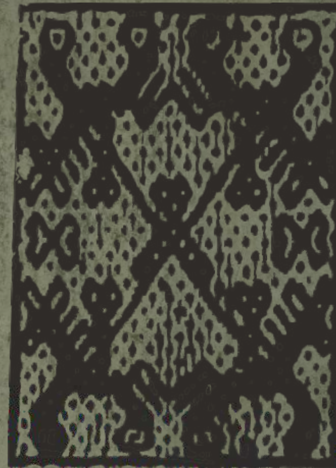
Textil de la comunidad de Cachin con iconografía sobre Túpaq Amaru

El Museo Histórico Regional del Cusco - Casa del Inka Garcilaso de la Vega, expone en su sala dedicada al precursor de la Independencia peruana, piezas textiles de época actual con caracterizaciones iconográficas que nos hablan de la permanencia túpacamarista que aún pervive en la memoria colectiva actual de nuestra población cusqueña. En estos tejidos se representa el descuartizamiento de José Gabriel Condorcanqui (Túpaq Amaru), como también está la imagen de su rostro con su característico sombrero. Hoy en día estos trabajos denominados "Pallay" son realizados por los artesanos textiles del poblado de Cachin - Calca, quienes aún mantienen viva la imagen del líder andino del siglo XVIII. A su vez los textiles andinos son expresiones de la identidad y resistencia cultural de los pueblos.