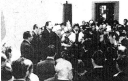
Inauguración de La Casa Museo José Carlos Mariátegui

formado por un mueble con las paredes empapeladas de ese color, con asientos de cuero en la parte baja y una repisa