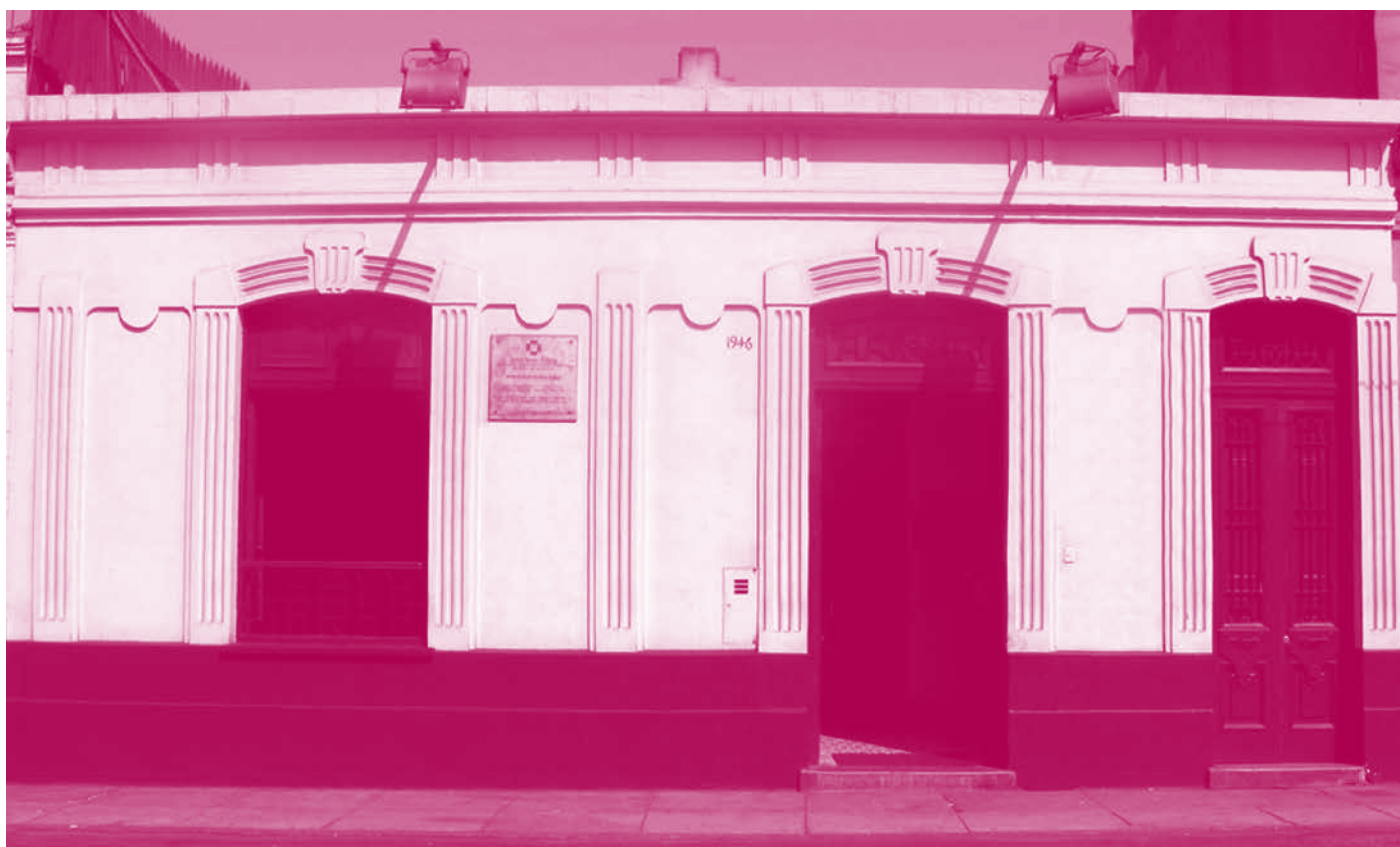
Casa Museo José Carlos Mariátegui, Lima.