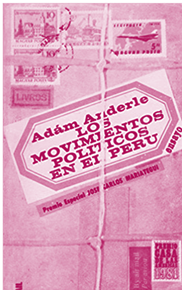
Portada del libro Los movimientos políticos en el Perú entre las dos guerras mundiales , publicado en español por Casa de las Américas, La Habana, en 1985.

En la persona de Ádám Anderle, llevamos luto por el catedrático respetado, el distinguido especialista de su área científica, el ilustre dirigente universitario y el profesor reconocido y firme de alumnos y doctorandos. Su vasta obra científica, sus libros escritos en un estilo entretenible no solo para los profesionales se guardan en las bibliotecas nacionales así como en las extranjeras, entre ellas, la Biblioteca Nacional de España y varias bibliotecas latinoamericanas. El profesor Ádám Anderle era un verdadero Maestro cuya presencia perdurará a través de sus alumnos antiguos y nuevos. Es tarea de sus colegas y alumnos húngaros y extranjeros que conservemos y cuidemos su herencia y espíritu.