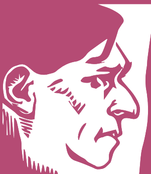
José Sabogal José Carlos Mariátegui ca. 1947, Xilografía.