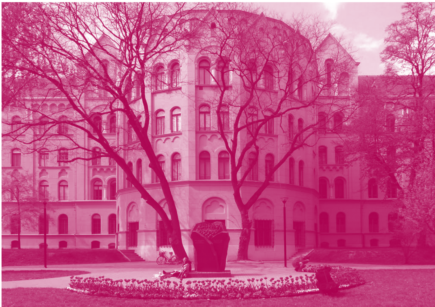
Edificio Central de la Facultad de Letras de la Universidad de Szeged.