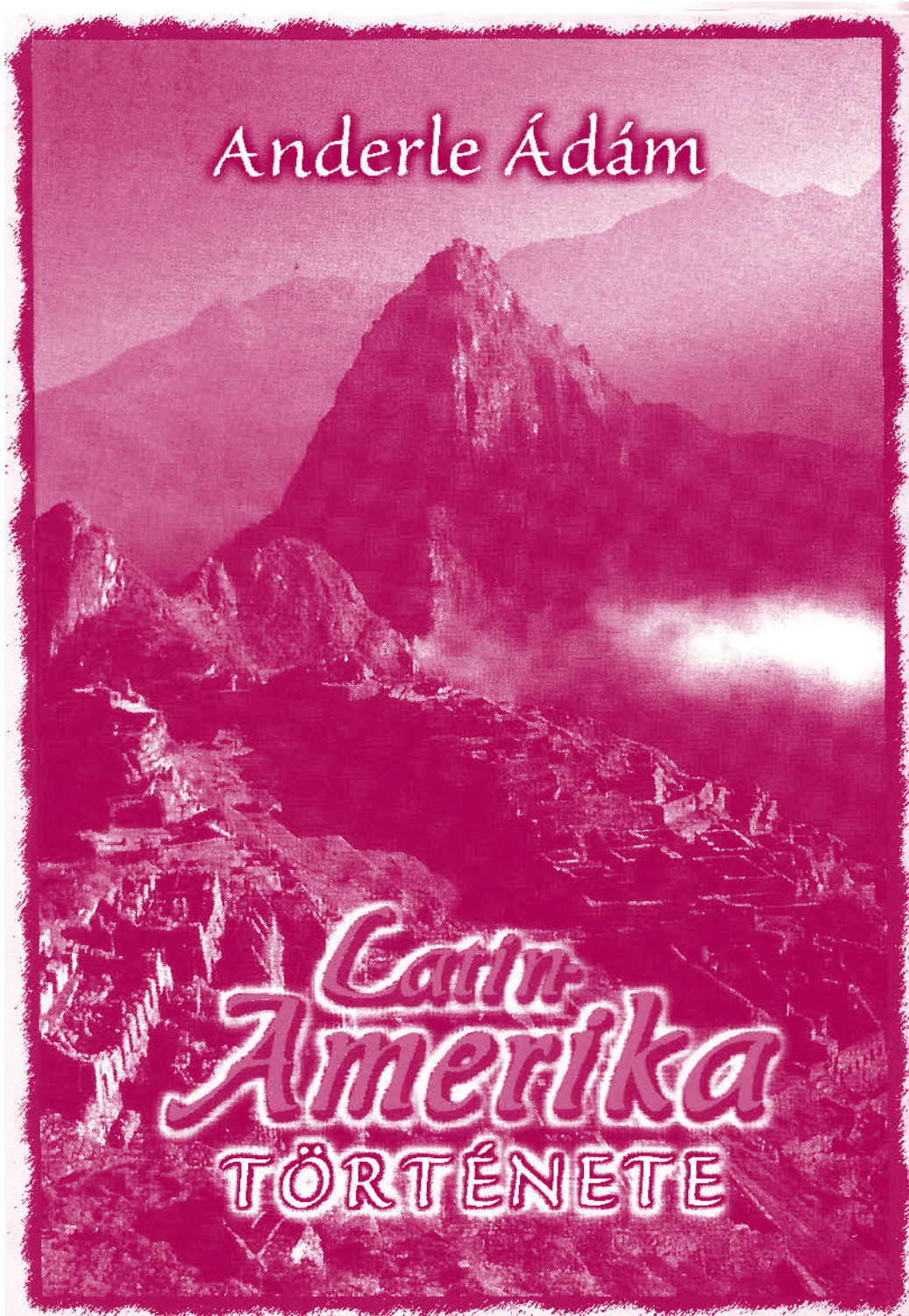
Portada del libro Historia de América Latina (1ª edición), publicado en húngaro en 1998.